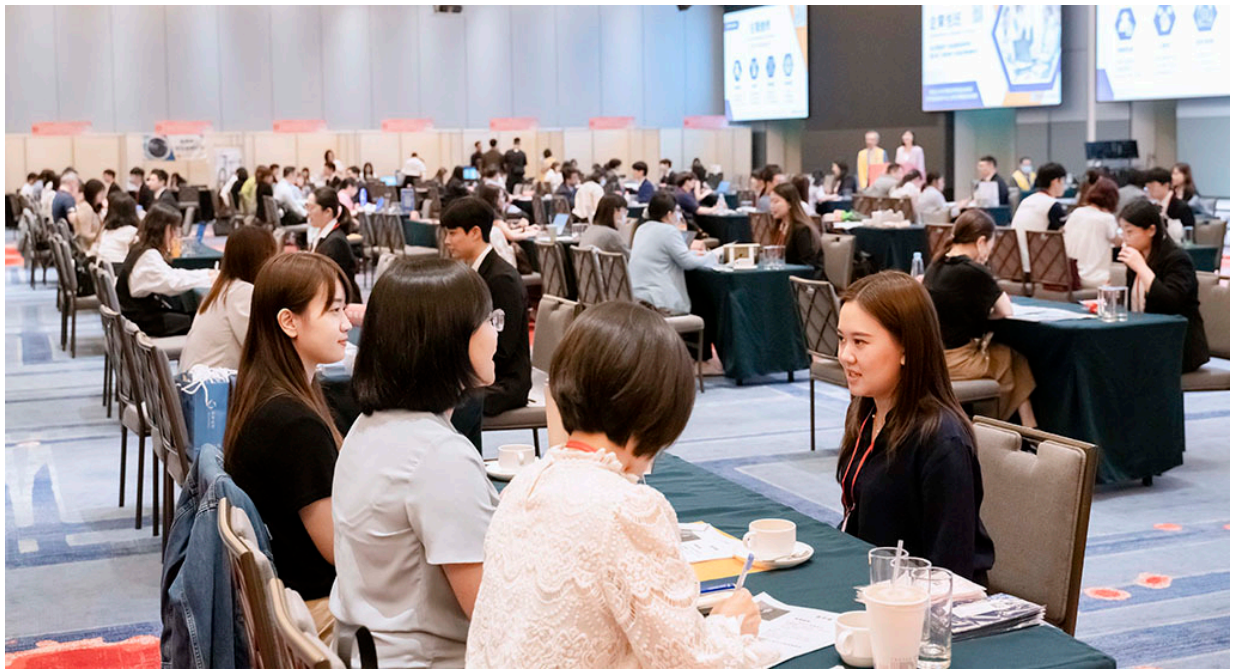
國企班學員與企業洽談熱絡。

欲了解更多ITI企業包班、商務英語與AI應用課程資訊，可造訪ITI官網（ https://talent.meettaiwan.com/iti/ ）或洽詢客服專線：03-5715182。